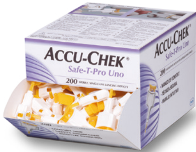
Accu-Chek Safe-T-Pro Uno 200 Stück Materialnummer 05888662150 PZN 06143663

Für die Anwendung in Klinik und Praxis: Accu-Chek Safe-T-Pro Uno und Accu-Chek Safe-T-Pro Plus