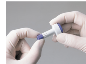
2. Stechtiefe bei Bedarf durch Drehen des Einstellringes ändern