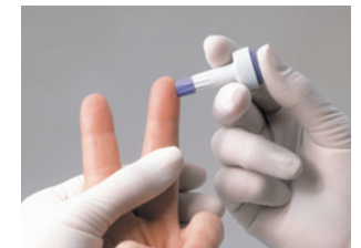
3. Stechhilfe fest auf die Einstichstelle setzen und den Auslöseknopf drücken