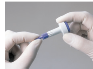
1. Sterilkappe abdrehen