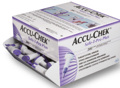
Accu-Chek Safe-T-Pro Plus 200 Stück Materialnummer 03603539150 PZN 01754184