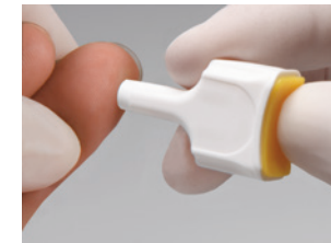
2. Stechhilfe fest auf die Einstichstelle setzen und den Auslöseknopf drücken